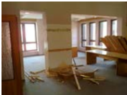
PROSTORY HERNY I.